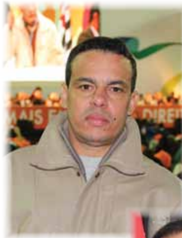
Vice-presidente do Sindigráficos assume como 3º Secretário da Secretaria de Seguridade Social na Força Sindical.