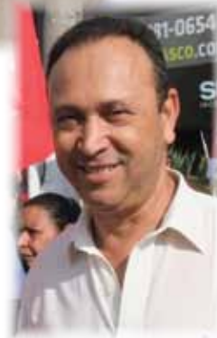
Presidente Joaquim de Oliveira marca presença no 7º Congresso da Força.

“Além de fortalecer os sindicalistas em frente aos seus sindicatos e a própria Força Sindical, o Congresso é uma experiência muito importante para trocarmos informações e debater assuntos de interesse do trabalhador. Aproveito para afirmar que o Sindigráficos irá aderir aos protestos previstos para o dia 30/8, em que iremos reafirmar a Pauta Trabalhista”, completa o vice-presidente.