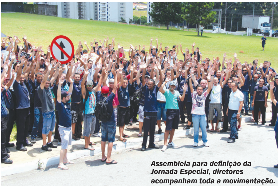
Assembleia para definição da Jornada Especial, diretores acompanham toda a movimentação.

Cerca de 90% dos trabalhadores aprovaram a nova escala. Parabéns aos trabalhadores e a direção da empresa, que democraticamente discutiram e chegaram a um horário que atende ambas as partes.