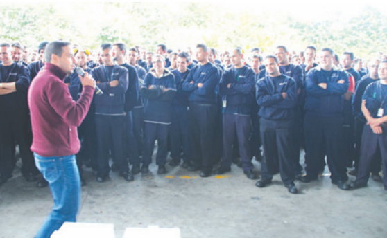
Sindicalista faz explanação sobre o novo horário de trabalho.