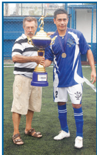
Equipe vencedora: Bíblica A

Para encerrar, o sindicato promoveu uma tarde de confraternização entre os jogadores, familiares e toda a torcida que estava na arquibancada, com direito a chopp, refrigerante, churrasco e muita animação! Confira nas fotos os principais momentos do evento: