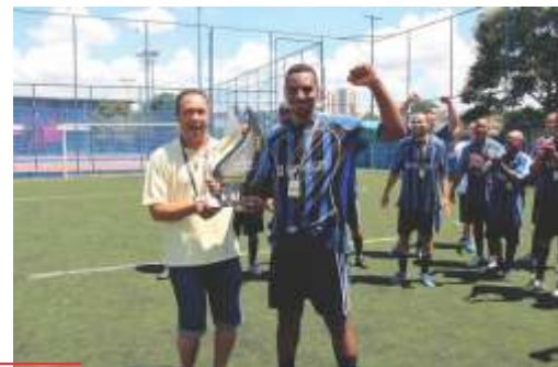
Representante da equipe Donnelley recebendo troféu de campeão!

No ano passado, a equipe Donnelley (A) ficou em primeiro lugar, seguida pela Laborprint (A), Aquarela e Sociedade Bíblica.