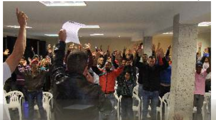
Gráficos votam itens que compõem nossa pauta de reivindicações

Ao lado de nosso Sindicato, categoria aprova a pauta de reivindicações