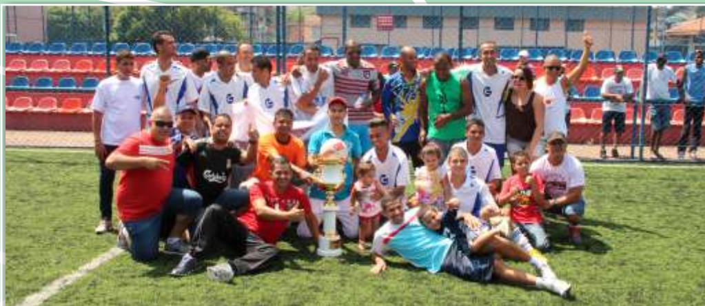
No último Campeonato, a equipe Gonçalves (B) levou o ouro!

Metalúrgicos de Osasco e Região), localizado no Rochdale (Rua Luiz Rink, 501), em Osasco.