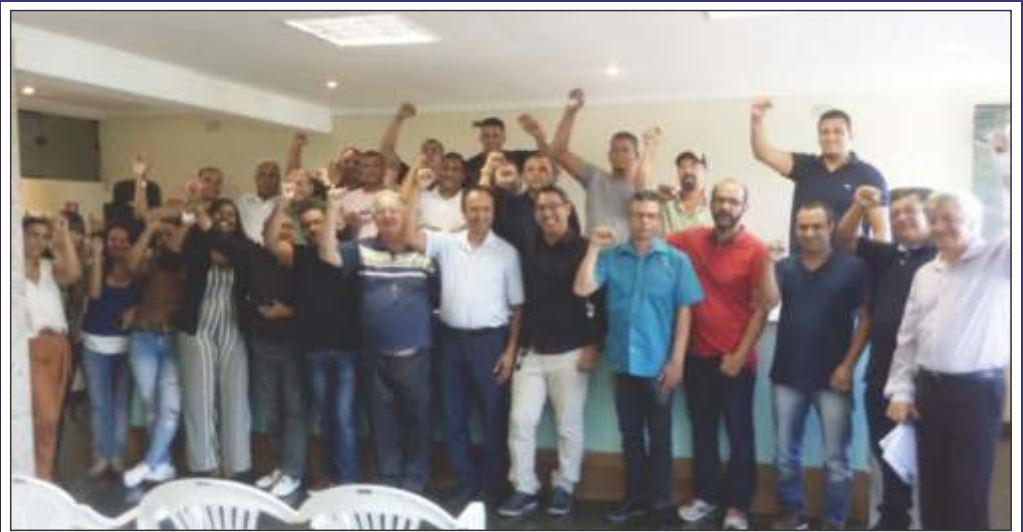
Nova diretoria do Sindigráficos iniciou gestão em maio

O presidente também ressaltou o trabalho de aproximação com a categoria que será realizado pela diretoria. "Nas empresas em que temos mais diretor de base é onde temos mais trabalhadores sindicali-