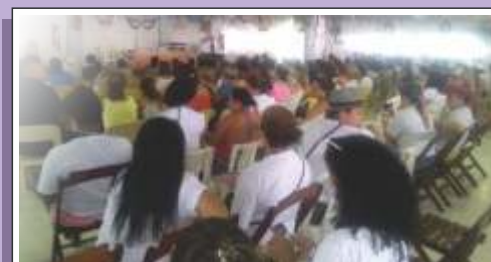
Encontro reúne conscientização e lazer

O evento aconteceu na Colônia de Férias do Sindicato dos Gráficos de São Paulo.